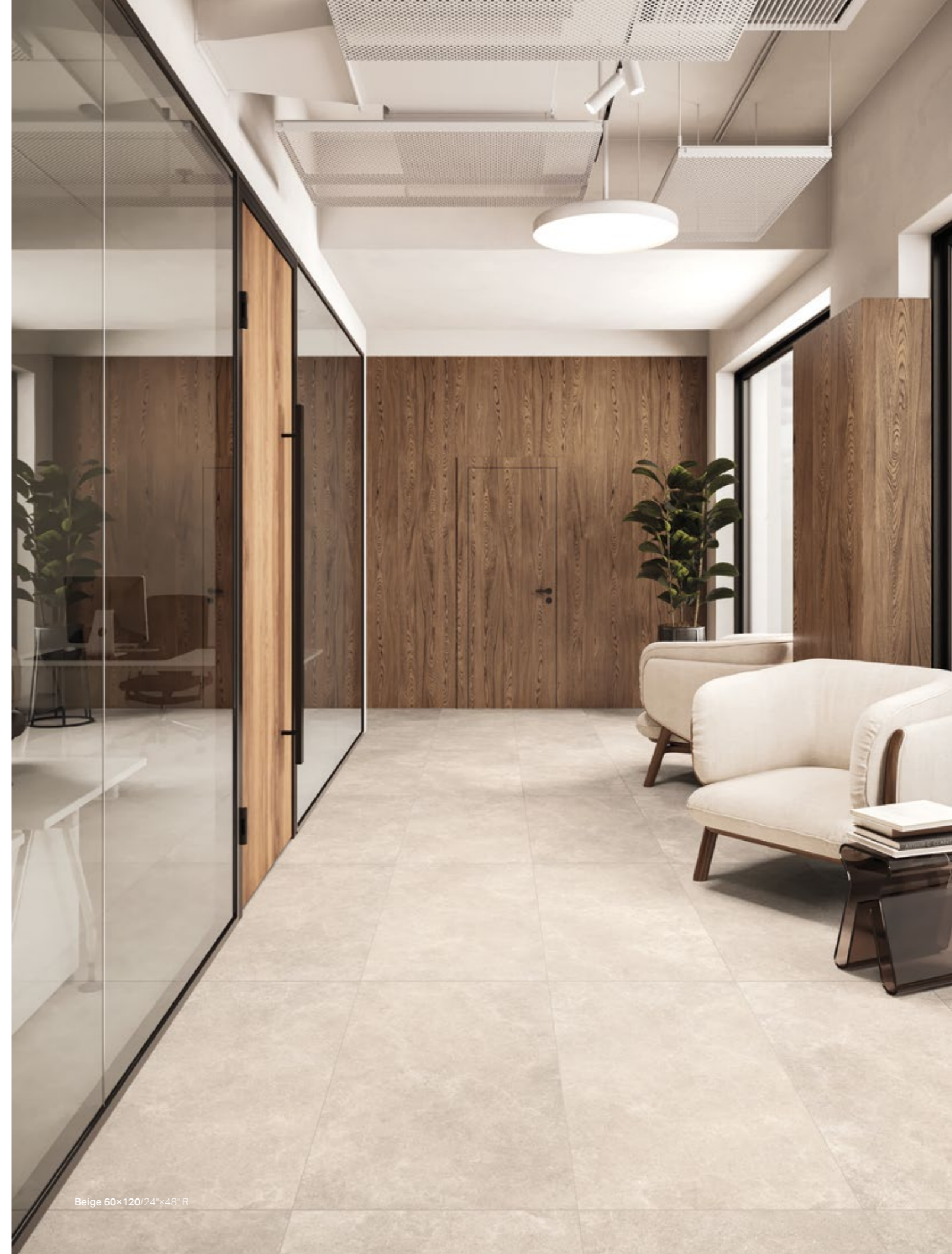
Beige 60×120/24"×48" R